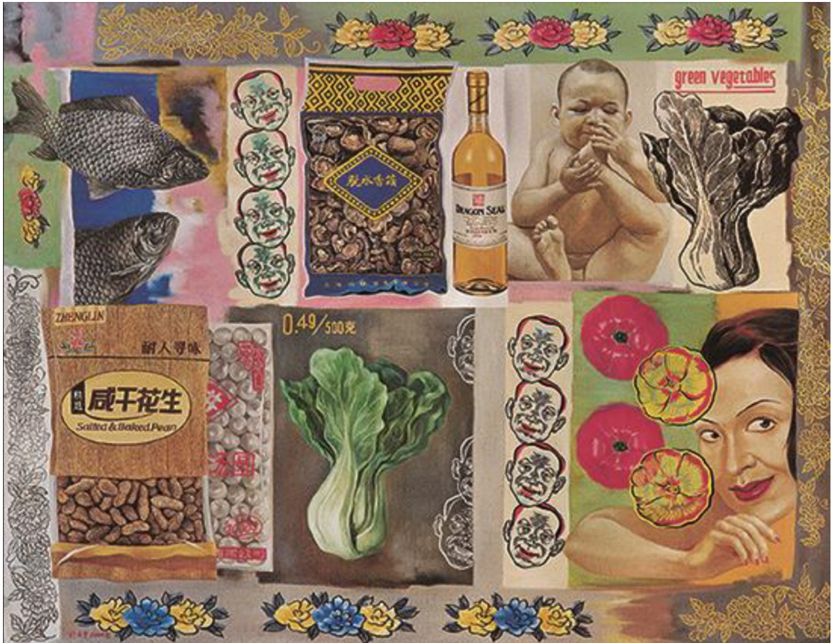
消费品 114cmX146cm 2004 布面油画