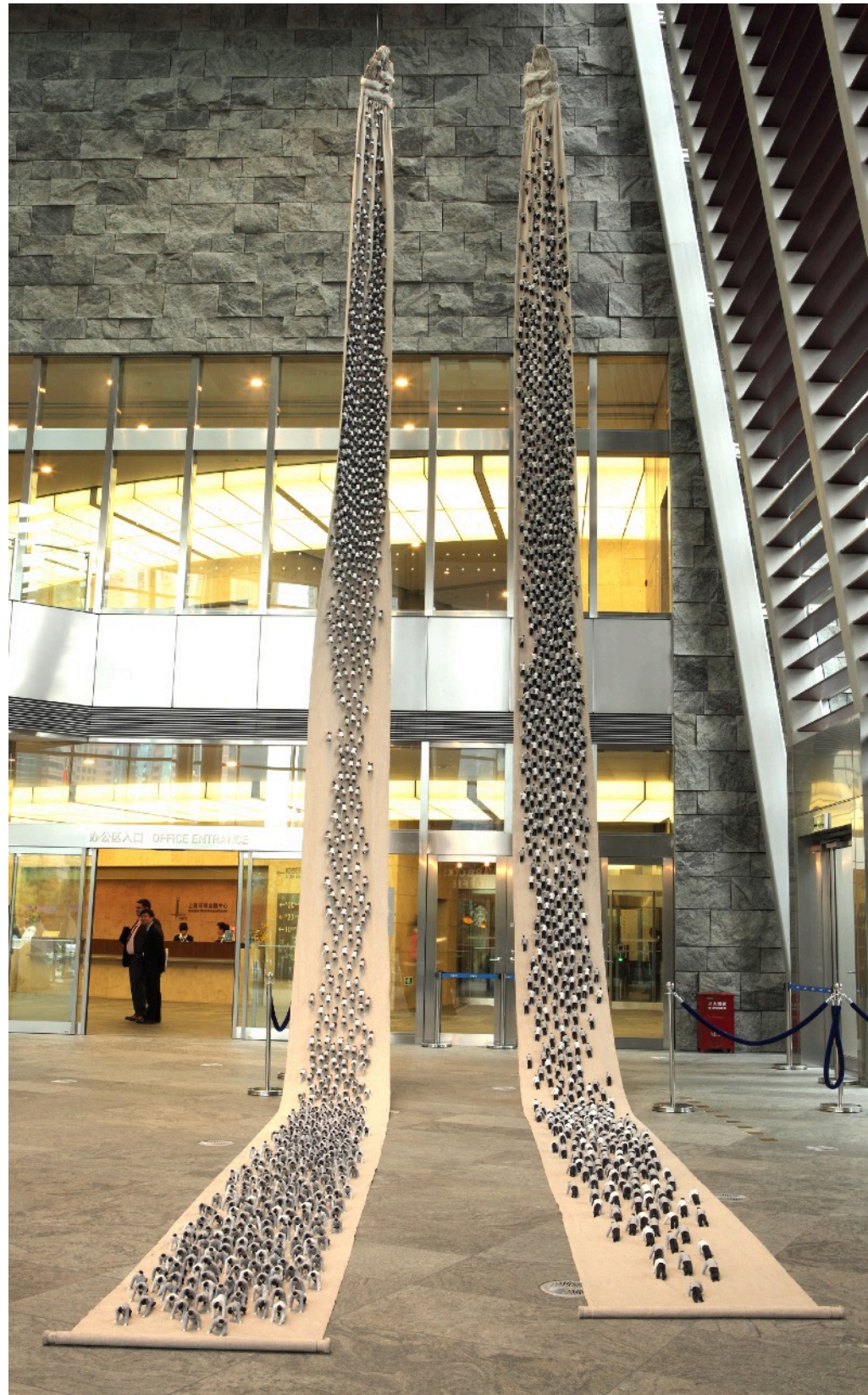
上山下山 1813X94X20cm 2009 软雕塑