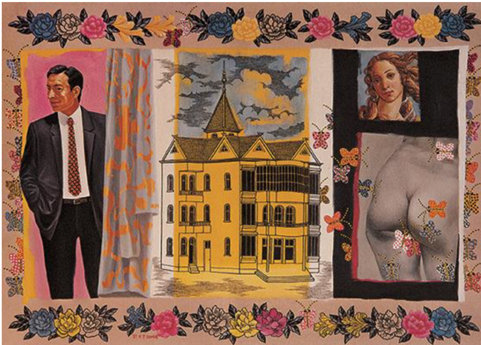
小洋楼 98cmX138cm 2004 布面油画