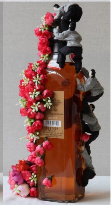
尊尼获加“拾贰相”：向前走，遇到艺术