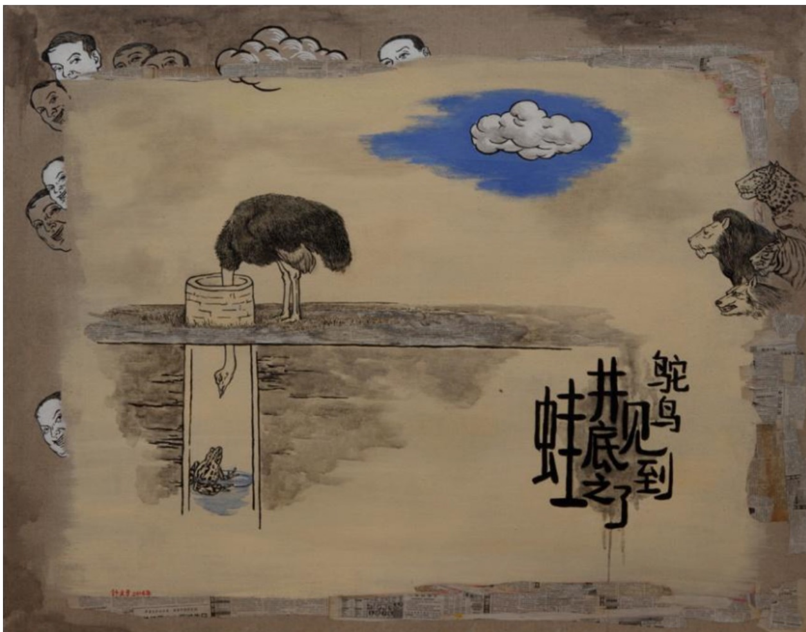
鸵鸟见到了井底之蛙 114cmX146cm 2014 布面丙烯