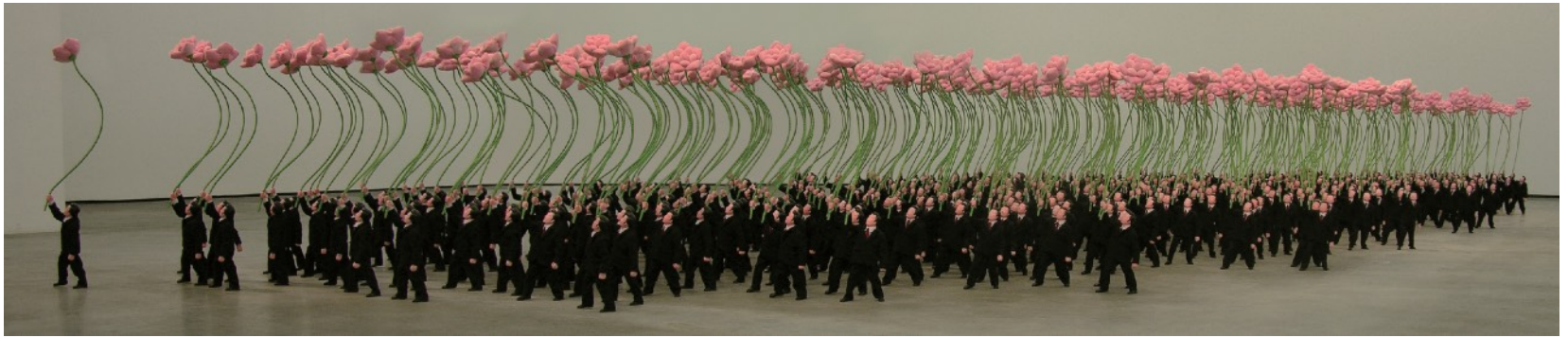
举花的人 17x11x102x400cm 2007 软雕塑