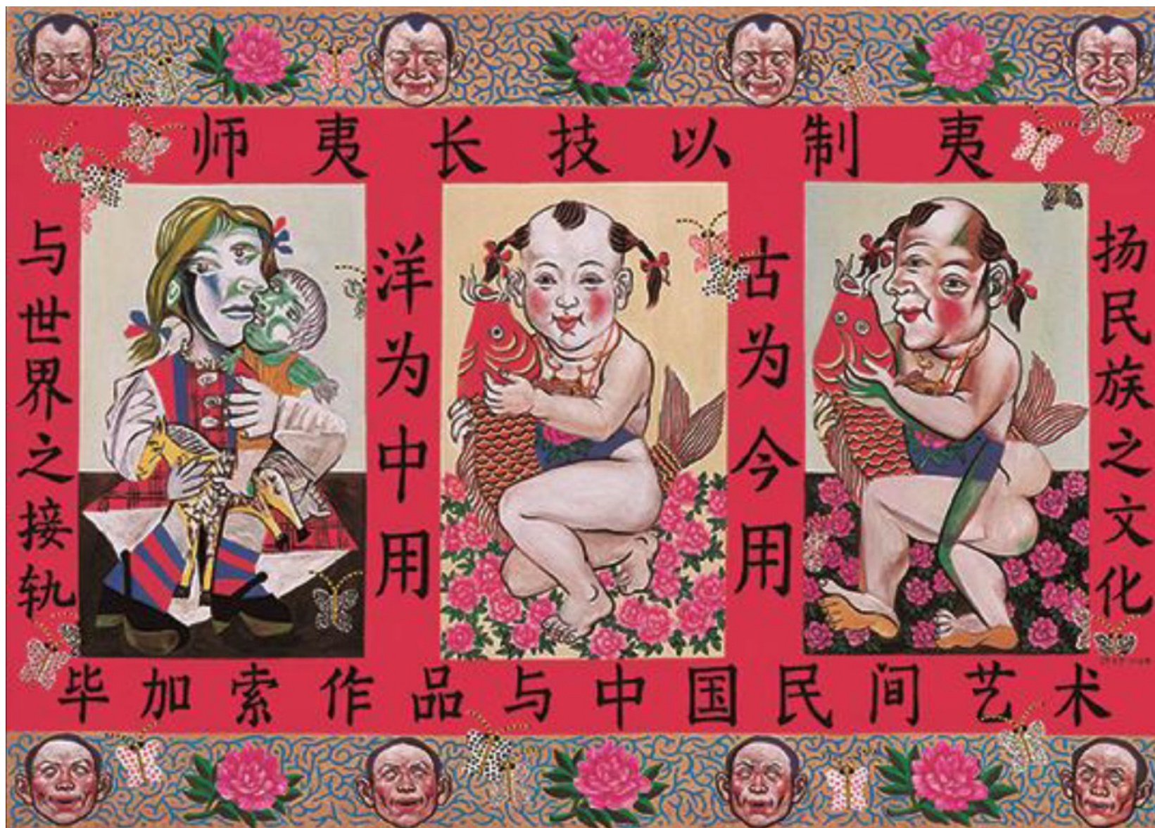
毕加索中国民间艺术 98cmX138cm 1999 布面油画