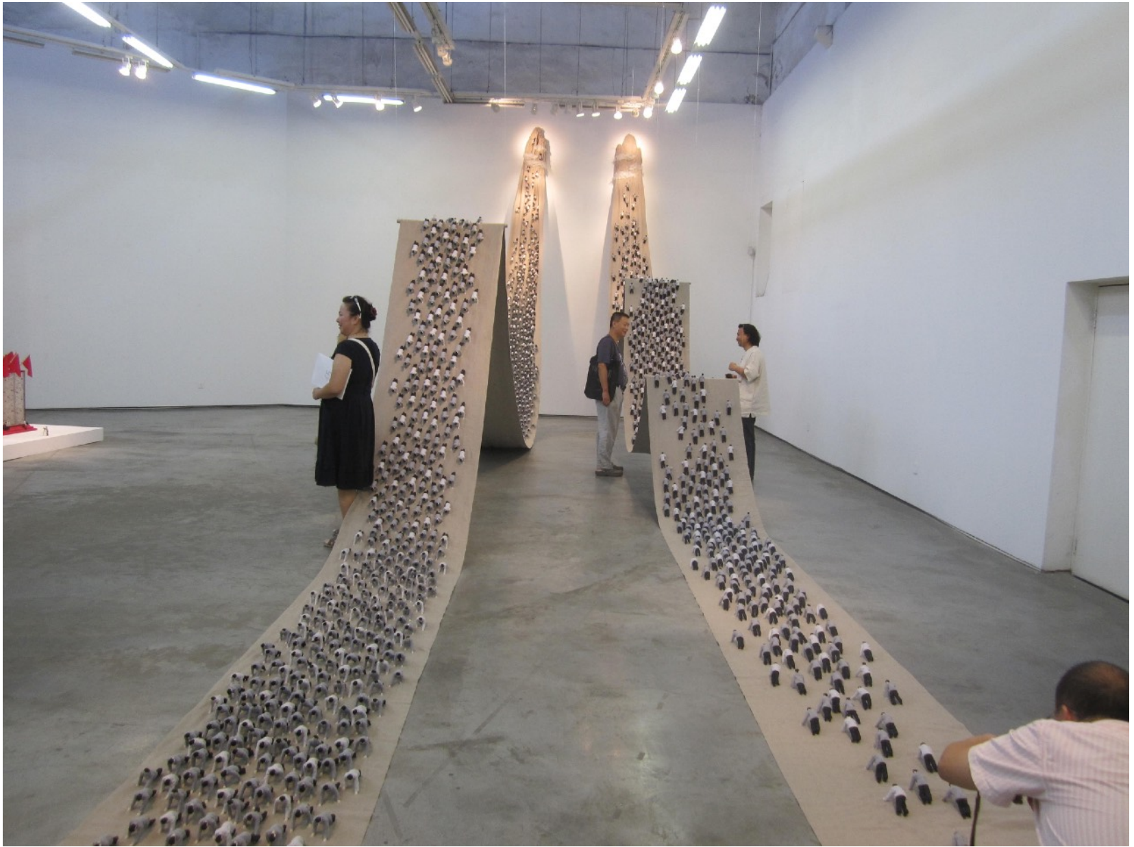
上山下山 1813X94X20cm 2009 软雕塑