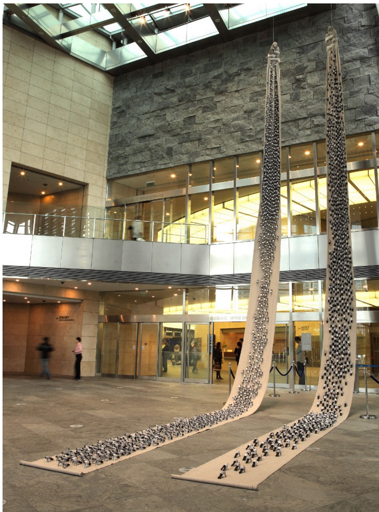
上山下山 1813X94X20cm 2009 软雕塑