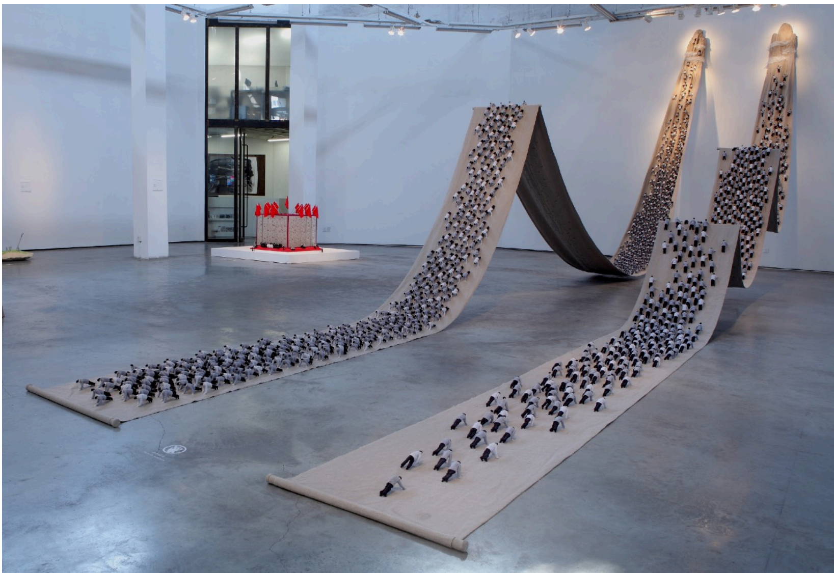
上山下山 1813X94X20cm 2009 软雕塑