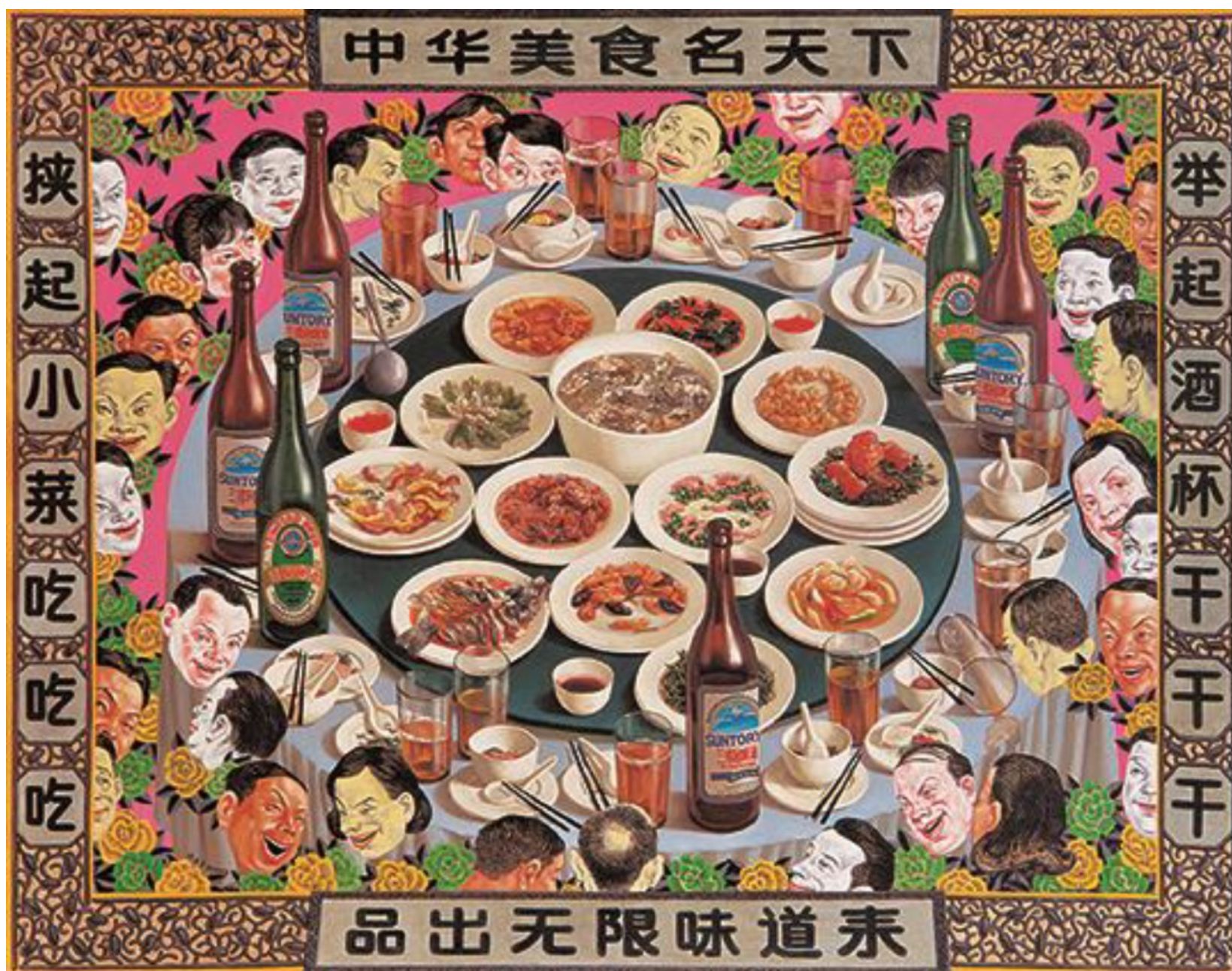
中华美食名天下 114cmX146cm 2003 布面油画