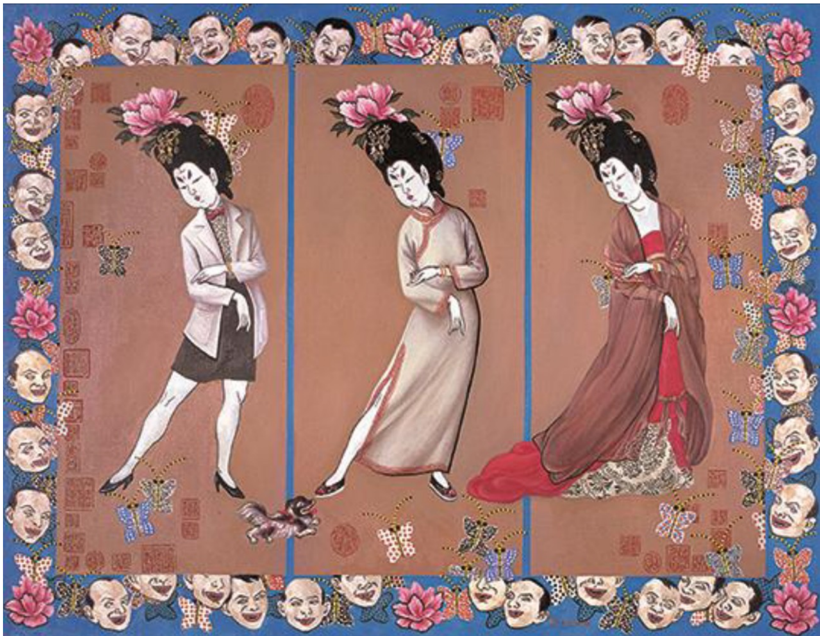
簪花美女图 89cmX116cm 1997 布面油画