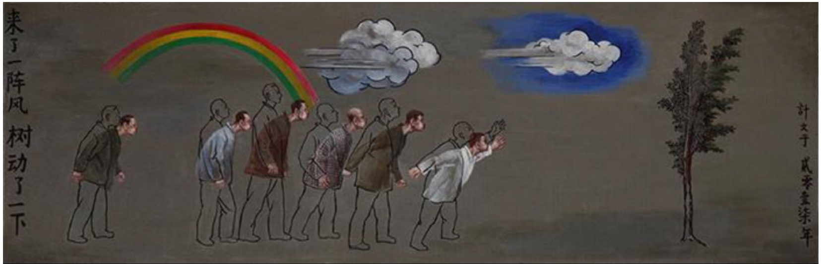
树动了一下 135cmX44cm 2017 布面丙烯