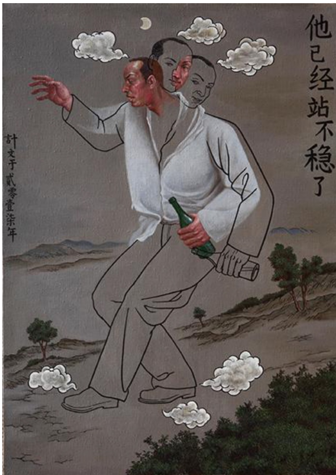
他已经站不稳了 98cmX138cm 2017 布面丙烯