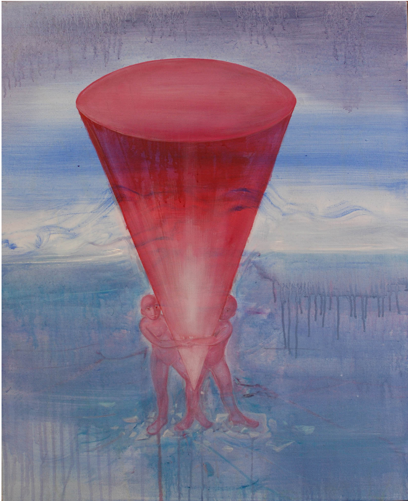
制造姿态17 60cmX85cm 2016 布面油彩