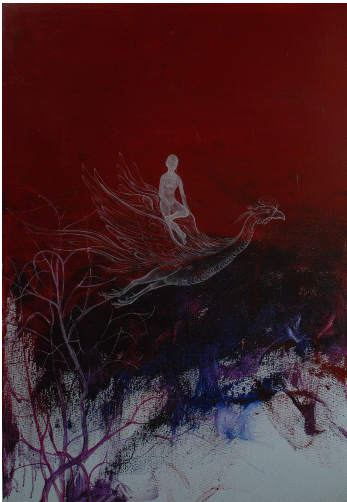
制造姿态9 56cmX80cm 2016 布面油彩