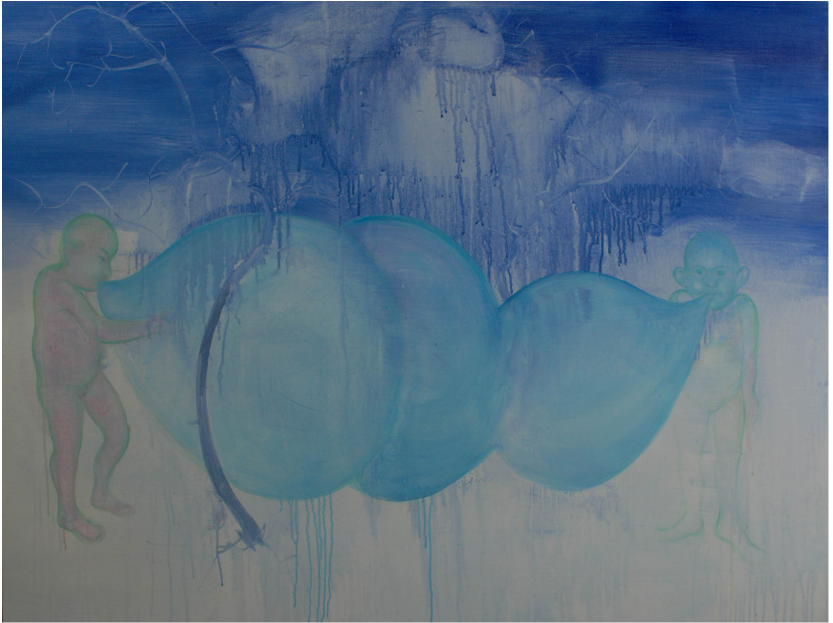
制造姿态8 90cmX120cm 2016 布面油彩