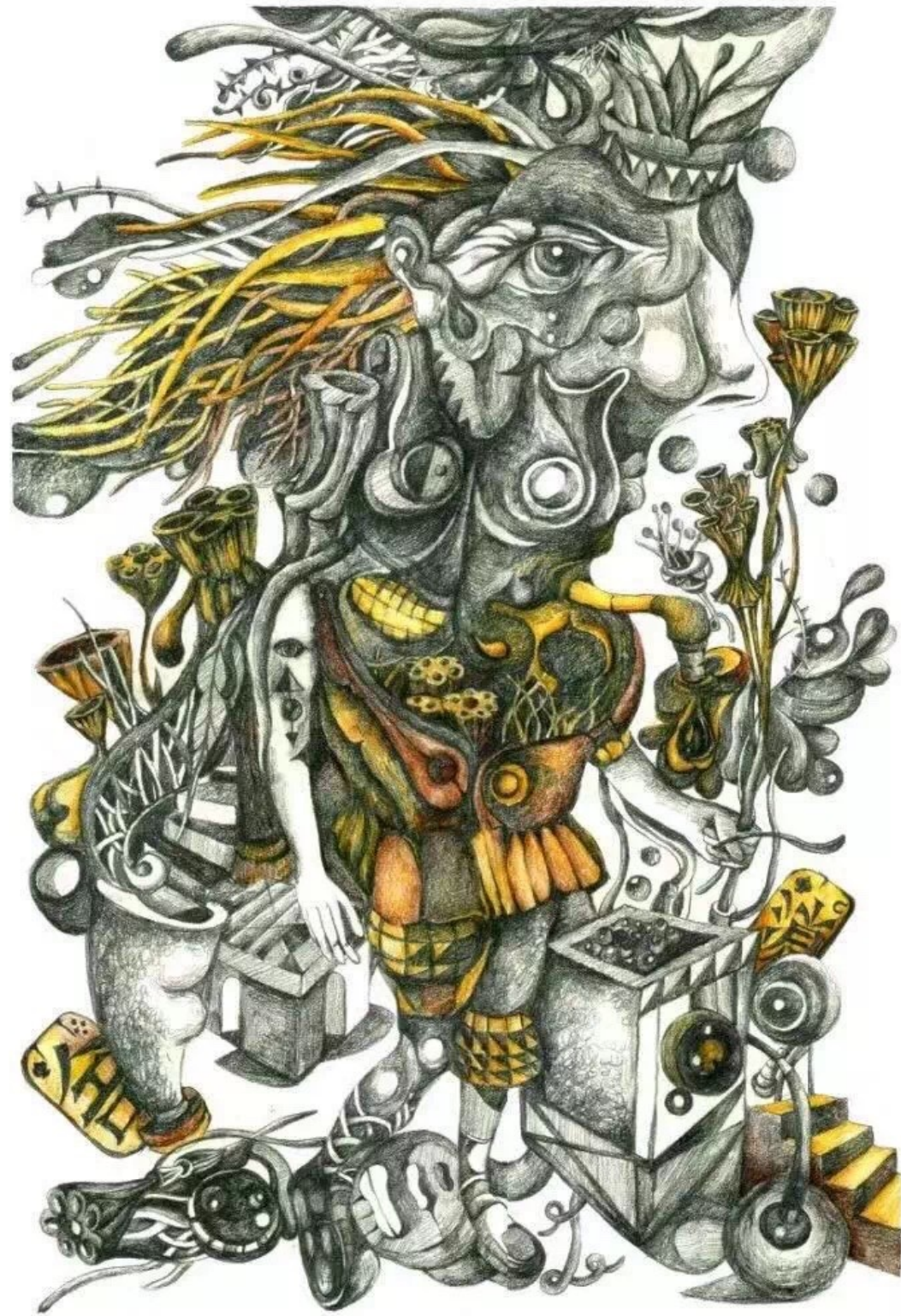
玩偶日记 77X53cm 2016-2018