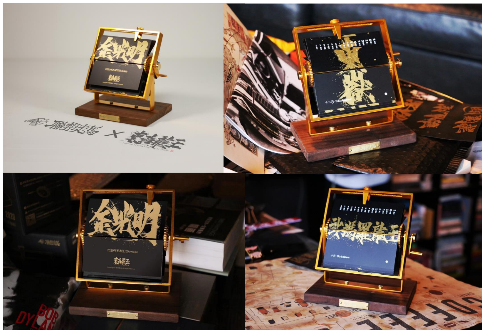
手动机械台历 衍生品