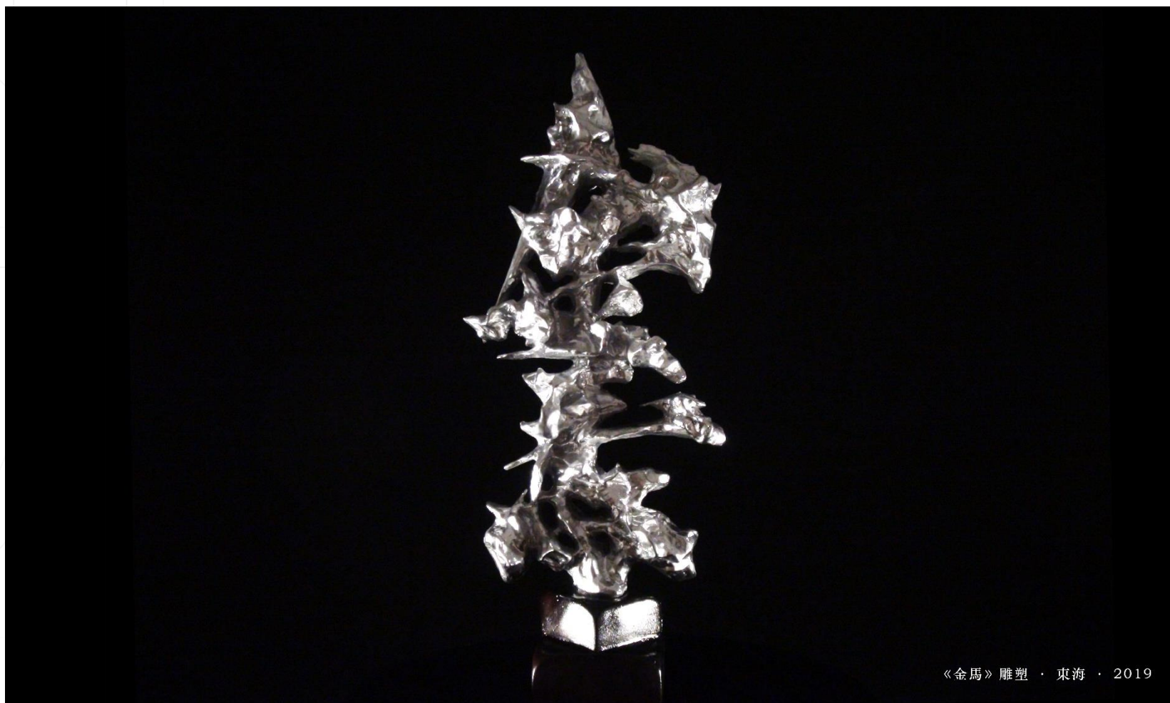
《金馬》雕塑 · 東海 · 2019