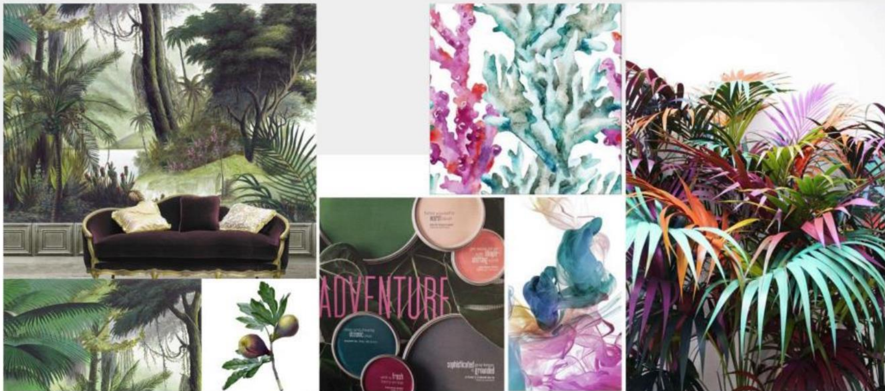
灵感主题 Inspiration Moodboard