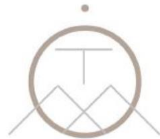
Mossitonna Design Studio