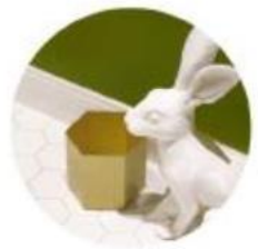
The team of UK overseas returnees has created original pattern design